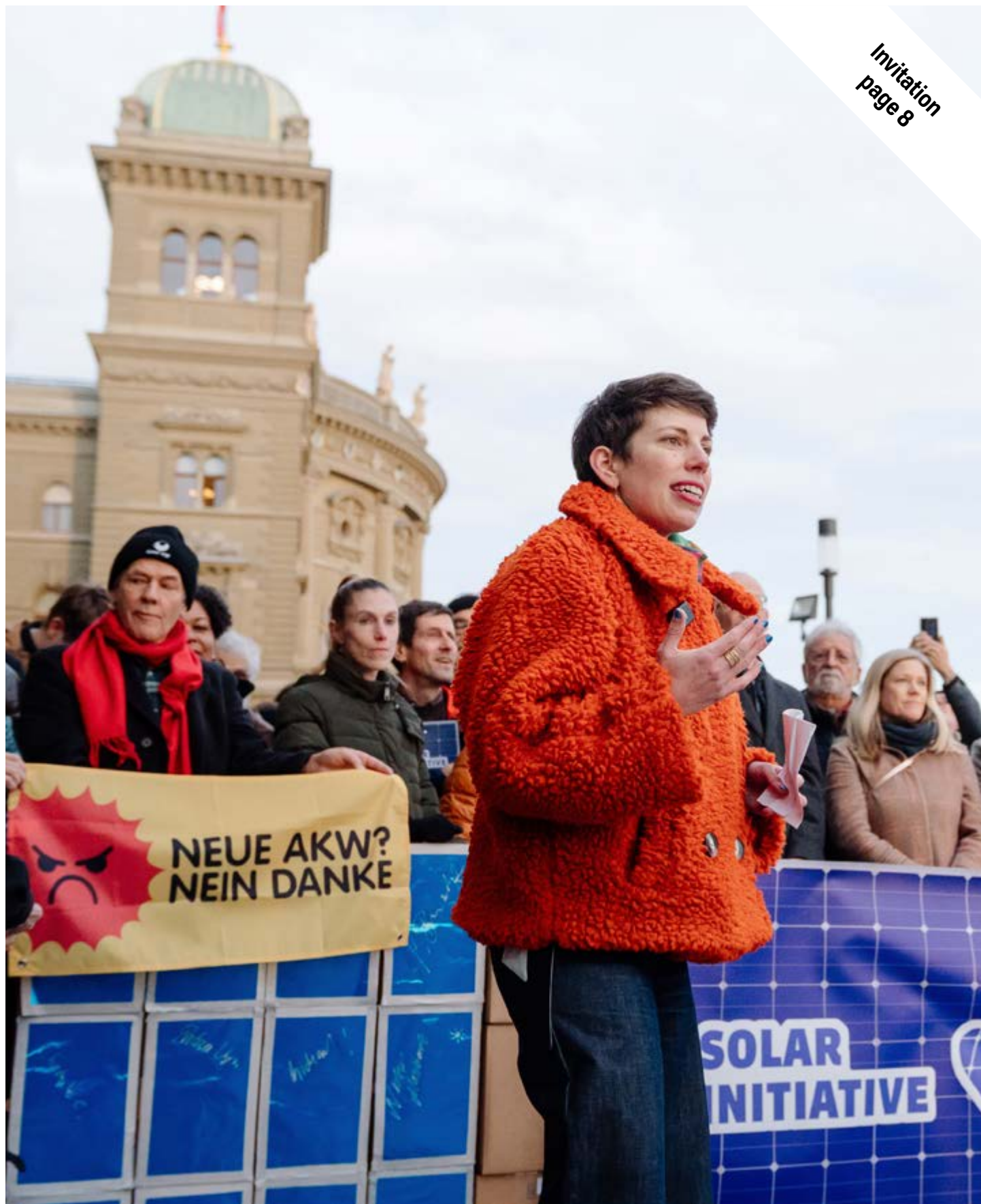
Lisa Mazzone, présidente des Verts , ancienne conseillère nationale, conseillère aux États à la remise des 134'000 signatures de l'initiative solaire, Palais fédéral, Berne, décembre 2025.