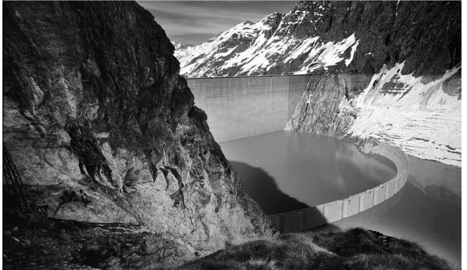
Alpiq annonce vouloir vendre 49% de son parc hydroélectrique, dont le barrage de la Grande-Dixence.

À moins qu'on ne finisse par subventionner le nucléaire qui n'a jamais été rentable, même en excluant les frais de démantè-