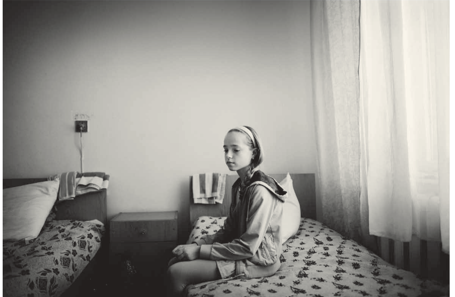
Une jeune fille au centre de recherche pour la médecine des rayonnements à l'hôpital des enfants à Kiev. 25 ans après l'accident nucléaire de Tchernobyl, les enfants souffrent d'atteintes aux voies respiratoires et d'autres maladies. Certains doivent rester à l'hôpital pendant une longue période.

L'ouvrage de Yablokov et al. se fonde sur une vaste compilation de plusieurs milliers d'articles scientifiques dans les domaines de la biologie végétale et animale ainsi que de la santé des êtres humains. Les éléments radioactifs (principalement Césium 137 et Strontium 90), déposés dans le sol, se transmettent aux végétaux (champignons), puis successivement aux animaux (lait des