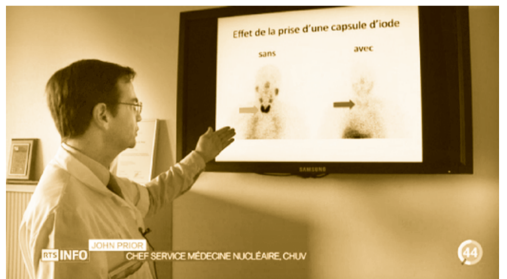
Téléjournal de 19h30 du dimanche 26.10

Nous l'avons bien vu avec Fukushima, en cas de catastrophe, le nuage ne va pas respecter la limite de 20 kms, pas plus que celle de 50 kms, sa propagation va dépendre du régime des vents : le nuage radioactif de Fukushima a atteint le Canada et les Etats-Unis après quelques jours seulement. La Confédération souhaite que ces coûts supplémentaires soient pris en charge par les exploitants des centrales, mais ceux-ci s'y opposent. Alpiq, BKW et Axpo nous montrent une fois de plus que la sécurité de la population n'est pas leur priorité ! La meilleure des sécurités et de fermer le plus rapidement ces vieilles centrales et de sortir enfin du nucléaire !