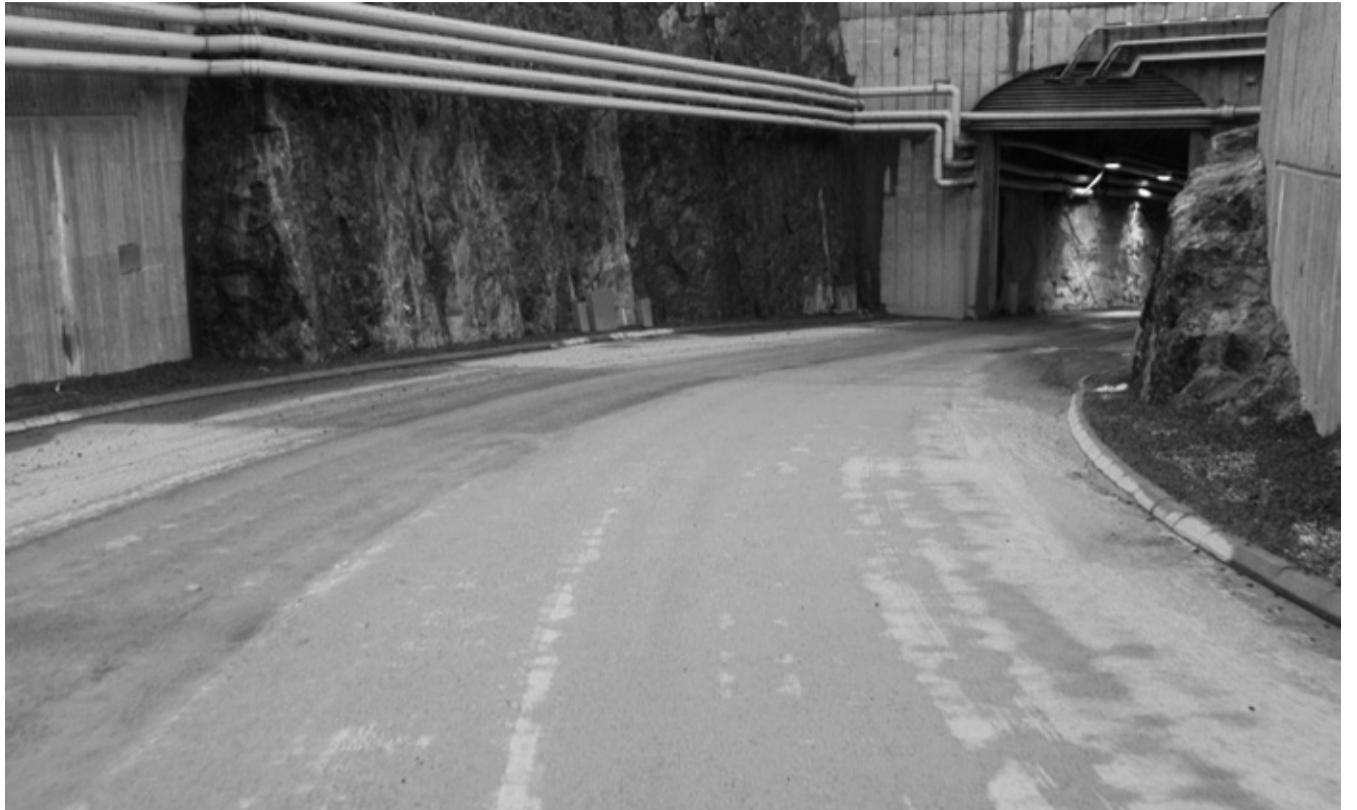
Entrée du futur dépôt de déchets radioactifs Onkalo en Finlande.

Le géologue Walter Wildi, membre démissionnaire de la Commission fédérale de la sécurité nucléaire (CSN) à qui nous proposons de participer à la discussion a répondu: «l'OFEN a accordé à la Nagra 20 années de plus pour résoudre la question de la recherche de sites de stockage: 2050 pour les déchets faiblement ou moyennement radioactifs et 2060 pour les déchets à haute activité. Aucun employé de l'OFEN, de la NAGRA, etc. sera encore en fonction. Autant dire que la Suisse a abandonné le projet d'élimination des déchets. Le projet est mort! Conséquence: Je reste à la maison par protestation. Bavardez toujours, cela ne changera rien!» M. Wildi a raison, c'était un débat en marge, le seul événement qui pourra changer les choses, c'est une nouvelle composition du Parlement fédéral, enrichi par des élus qui oseront faire payer le prix réel de l'électricité d'origine nucléaire au lieu de repousser les vrais coûts sur le dos de nos enfants et des leurs. Un Parlement qui dépendra donc du vote de citoyens, dont la septantaine de jeunes venus assister à la projection et au débat. Ca a été l'occasion pour eux d'entendre des faits dérangeants sur notre incapacité à gérer les déchets les plus toxiques et les plus durables sur Terre, d'entendre aussi l'histoire du bricolage de solutions qui ont jusqu'à maintenant été préconisées comme «définitives», avant d'être